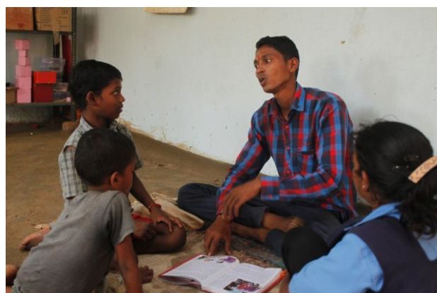
ऊपर से घड़ी की दिशा में: योग, कहानी, कला